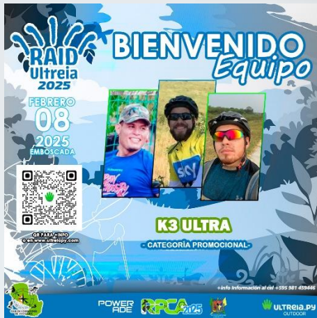
FOTO DE BIENVENIDA A LA CARRERA DEL EQUIPO

Enviar al correo de ultraia.py@gmail.com las fotos de forma individual o grupal de los miembros del equipo, con los datos de Nombre de equipo, categoría y @ de Instagram de los miembros.